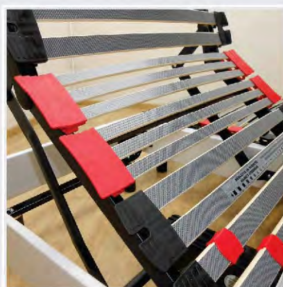
Zone épaules assouplie par 2 tri-lattes.