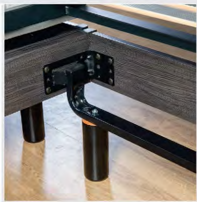
Traverses acier supports de pieds