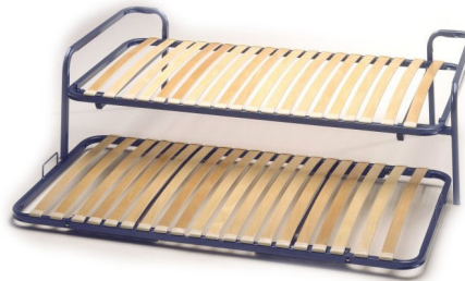
version pieds accoudoirs