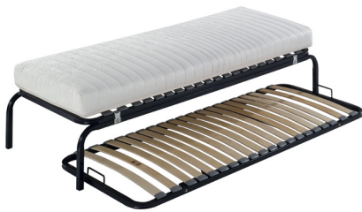
version pieds intégraux