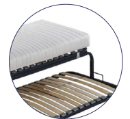
Pieds du lit supérieur au choix : pieds accoudoirs ou pieds intégraux